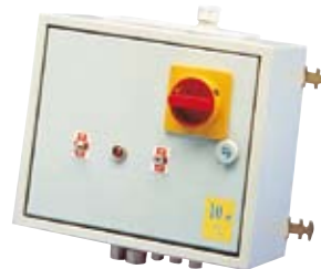
CENTRALINE PER BASI MULTIPLE ELECTRIC CONTROL PANELS FOR BASEPLATECOMPRESSORS