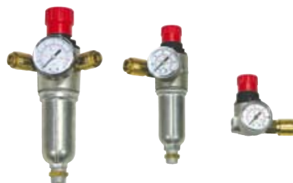
RIDUTTORI DI PRESSIONE PRESSURE REDUCERS