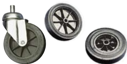
RUOTE FISSE E PIVOTTANTI WHEELS FOR TANKS