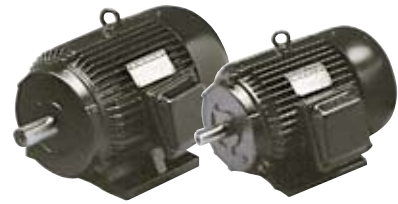
MOTORI V400/700 - 50HZ ELECTRIC MOTORS V400/700 - 50HZ