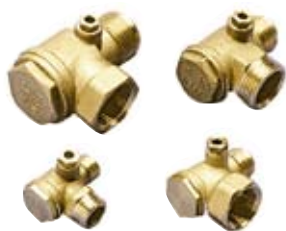
VALVOLE RITENUTA NON RETURN VALVES