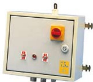
CENTRALINE TANDEM 50 HZ ELECTRIC CONTROLS PANELS 50 HZ FOR TANDEM COMPRESSORS