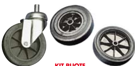
KIT RUOTE WHEELS KIT FOR TANKS