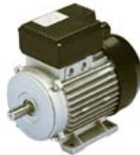
MOTORIV230-230/400 50HZ MOD. B3 B3 TYPE ELECTRIC MOTORS V230 - 230/400 50 HZ