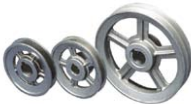
PULEGGE MOTOR PULLEYS