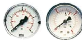
MANOMETRI PRESSURE GAUGES