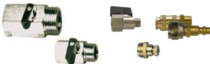
RUBINETTI LINE VALVES