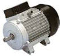
MOTORI RAIDER 50HZ SPRING TYPE ELECTRIC MOTORS