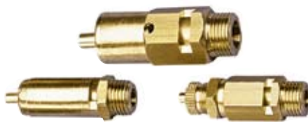
VALVOLE DI SICUREZZA SAFETY VALVES