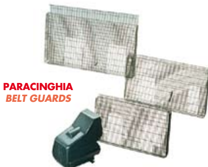
PARACINGHIA BELT GUARDS