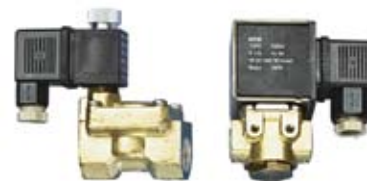
ELETTROVALVOLE SOLENOID VALVES