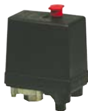
PRESSOSTATI - TELEPRESSOSTATI MAGNETOTERMICI PRESSURE SWITCHES -PRESSURE SWITCHES WITH MAGNETIC OVERLOAD CUTOUT